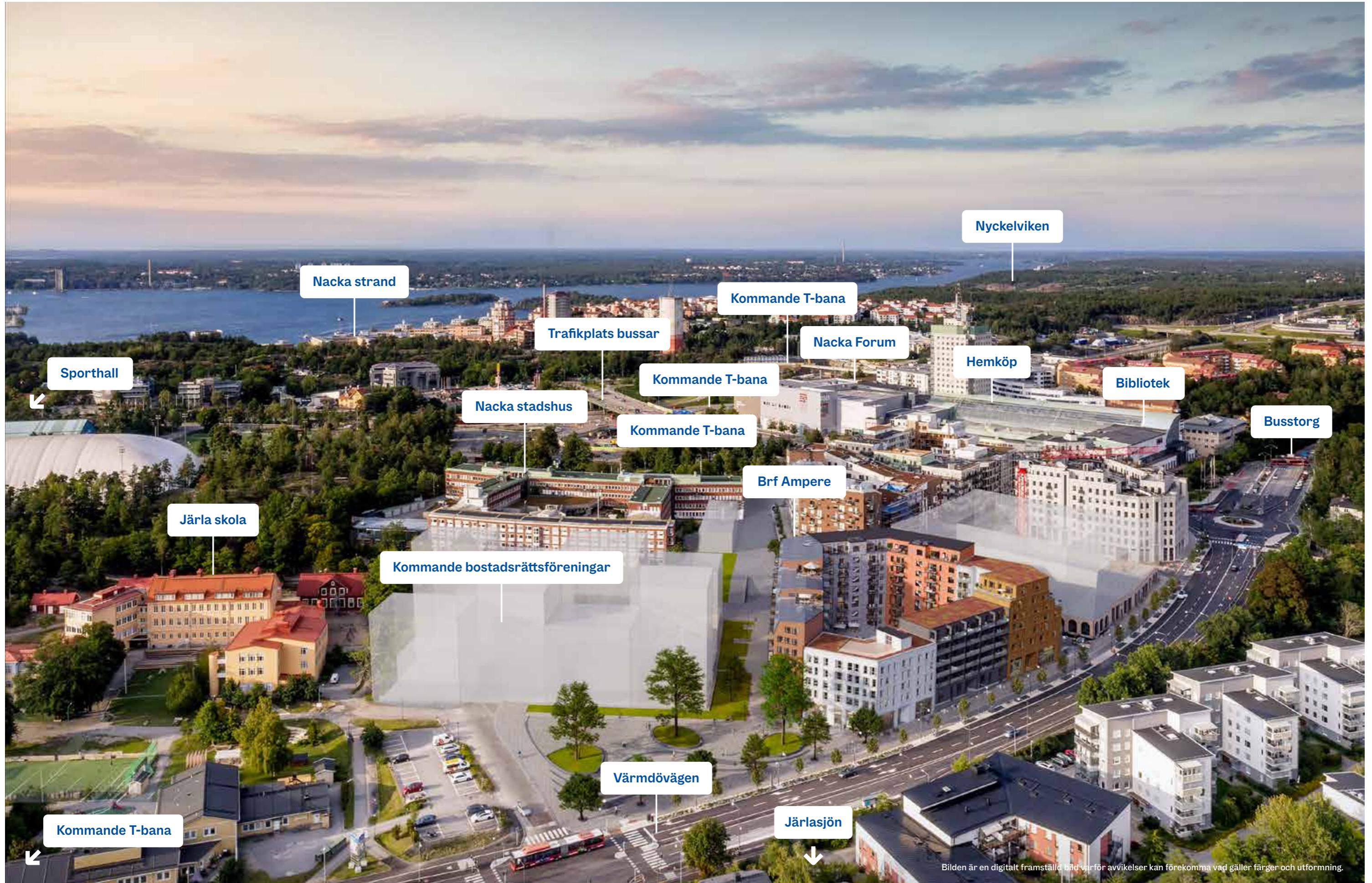
Bilden är en digitalt framställd bild varför avvikelser kan förekomma vad gäller färger och utformning.