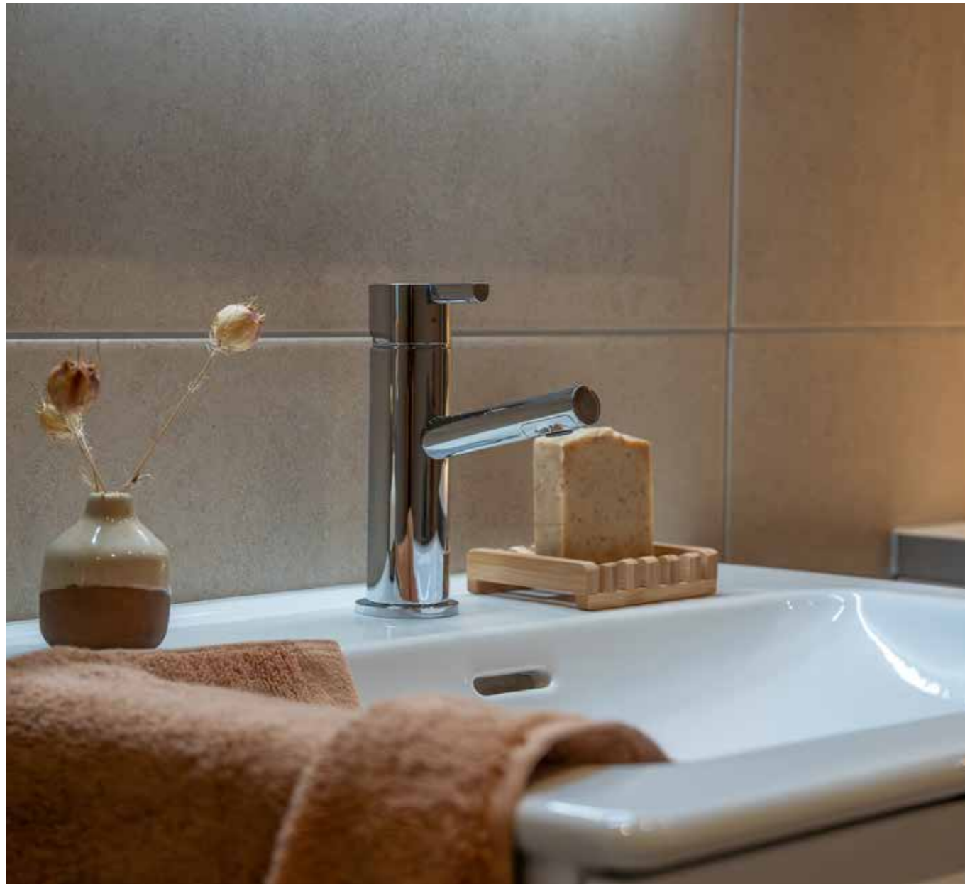
↑ Designlinje Höst.