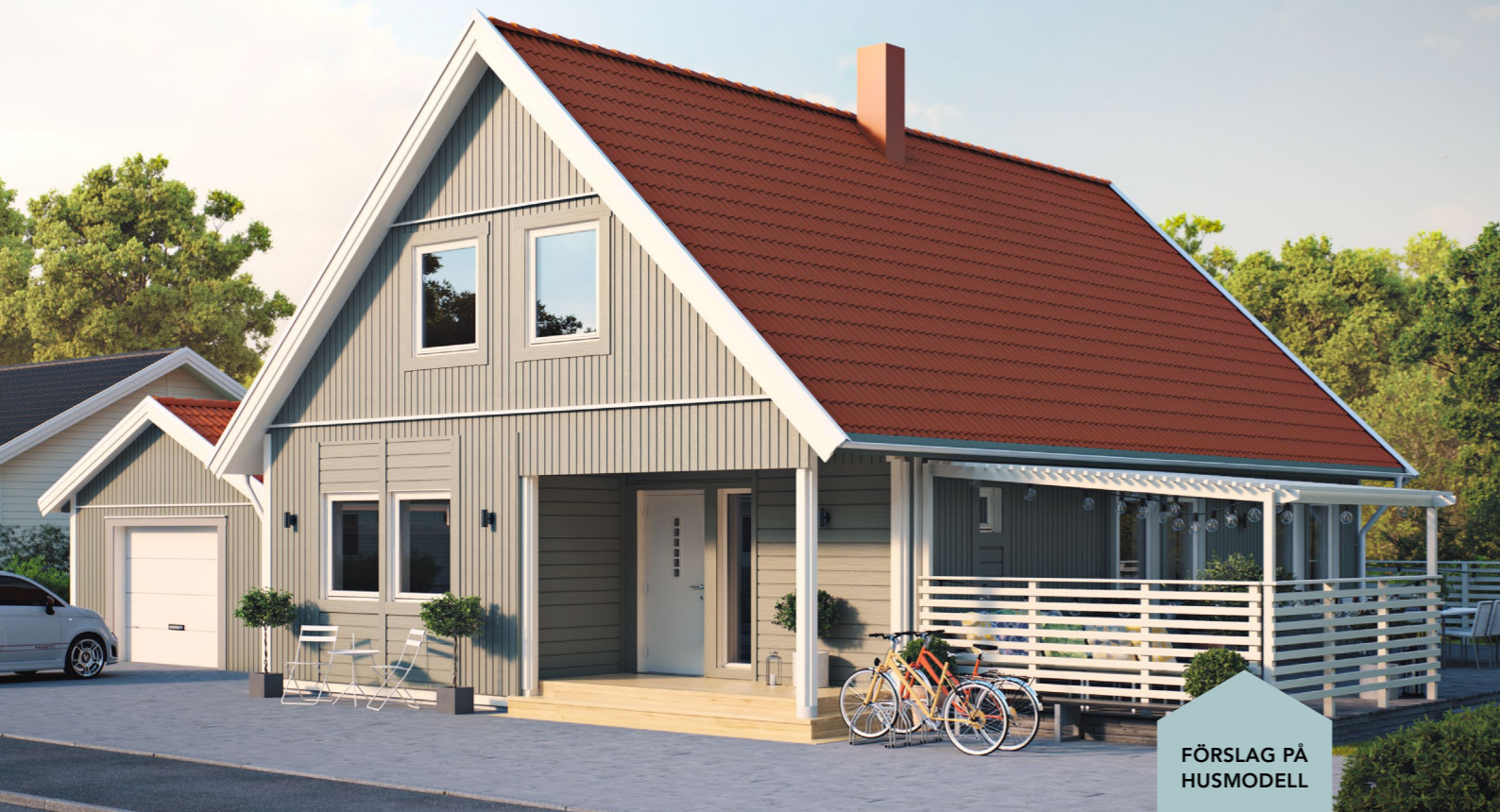
FÖRSLAG PÅ HUSMODELL