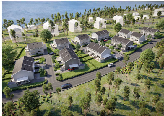
Bilden är en digitalt framställd bild varför avvikelser kan förekomma vad gäller färger och utformning.